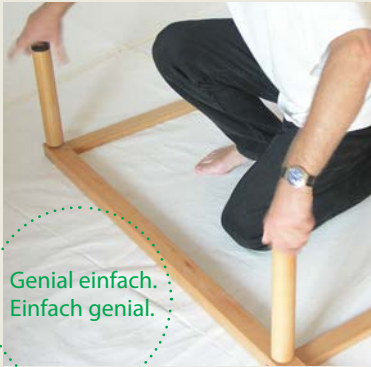
Bettfüße werden eingeschraubt

Längszargen 4 x 5 cm, Quersargen 2 x 5 cm. im Eckbereich eingefräste Holzgewinde zur Aufnahme der Bettenfüße und Einfräsungen zum Einlegen der Lattenrostleisten