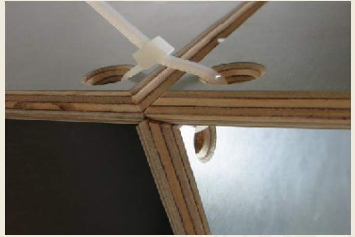
Detail: Plattenverbindung mit Kabelbinder