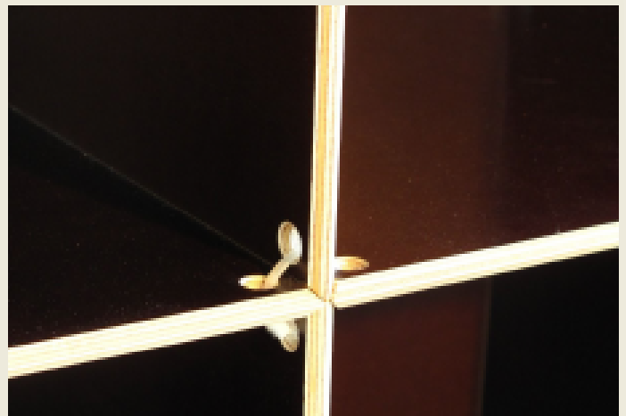
Detail: Plattenverbindung mit Kabelbinder