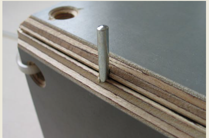
Detail: Außenkante mit Metallstift