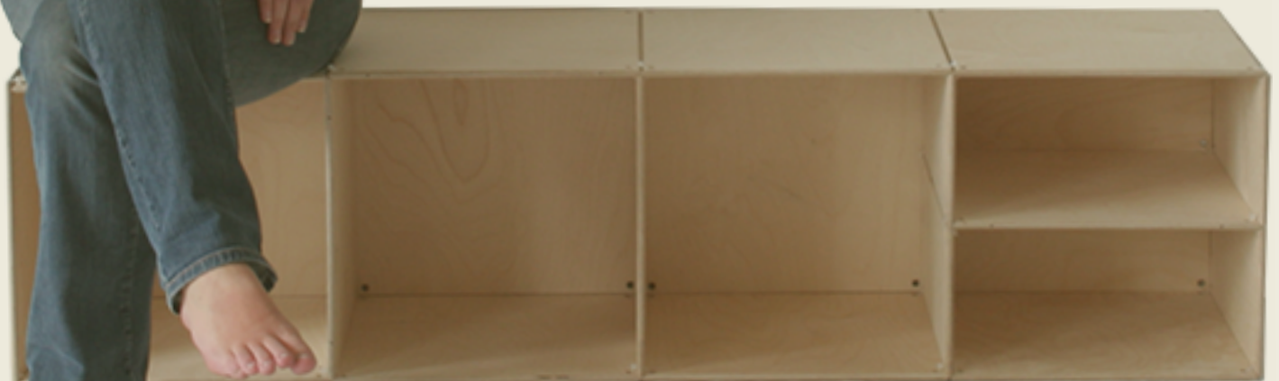
Platten natur in groß und klein