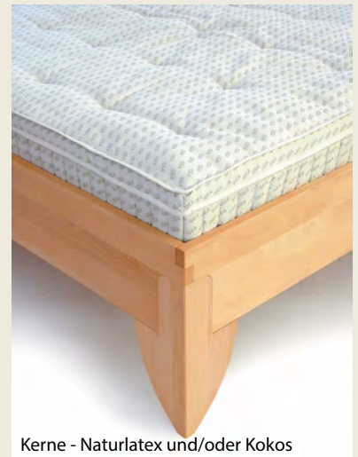
Kerne - Naturlatex und/oder Kokos

Ab Lieferung ist innerhalb von 4 Wochen ein Kerntausch möglich!