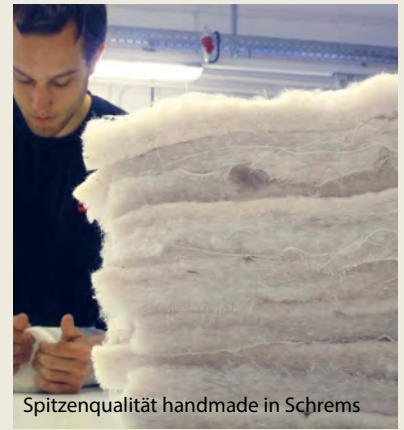
Spitzenqualität handmade in Schrems