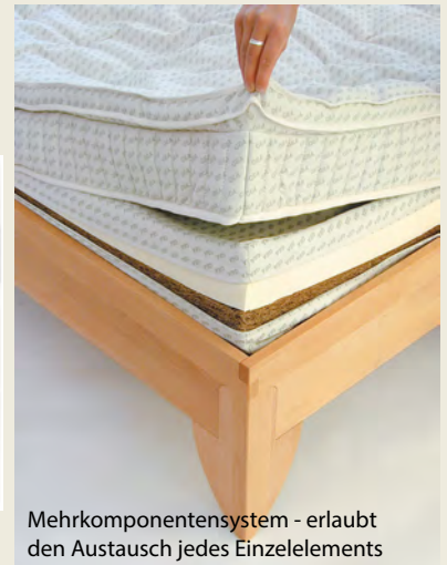
Mehrkomponentensystem - erlaubt den Austausch jedes Einzelelements